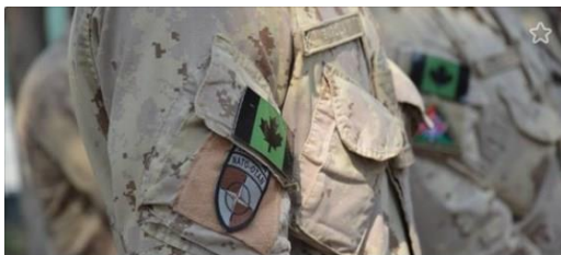
85% of Canadian troops ordered into isolation to prepare for COVID-19 operations

Damit sind wir bei dem Thema „Kinder“ angelangt.