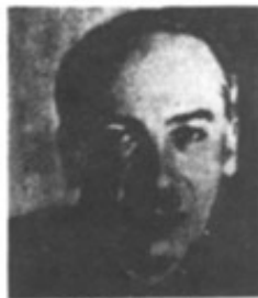
15. Genrich Jagoda

Klasse, und zwar so sehr, dass die Kommunistische Partei den beispiellosen Schritt ergriff, den Antisemitismus zum konterrevolutionären Delikt zu erklären, das mit dem Tode bestraft werden konnte 55 . In ihrer Ausgabe vom Januar 1942 schrieb die New Yorker Jewish Voice : "Das jüdische Volk wird niemals vergessen, dass die Sowjetunion das erste und bisher einzige Land der Welt ist, das dem der Antisemitismus ein Verbrechen ist." Und das Congress Bulletin , eine Publikation des American Jewish Congress, hielt am 5. Januar 1940 fest: "Der Antisemitismus wurde als konterrevolutionär eingestuft, und die für antisemitische Akte verhängten schweren Strafen waren das Mittel, mit dem die bestehende Ordnung ihre eigene Sicherheit gewährleistete."