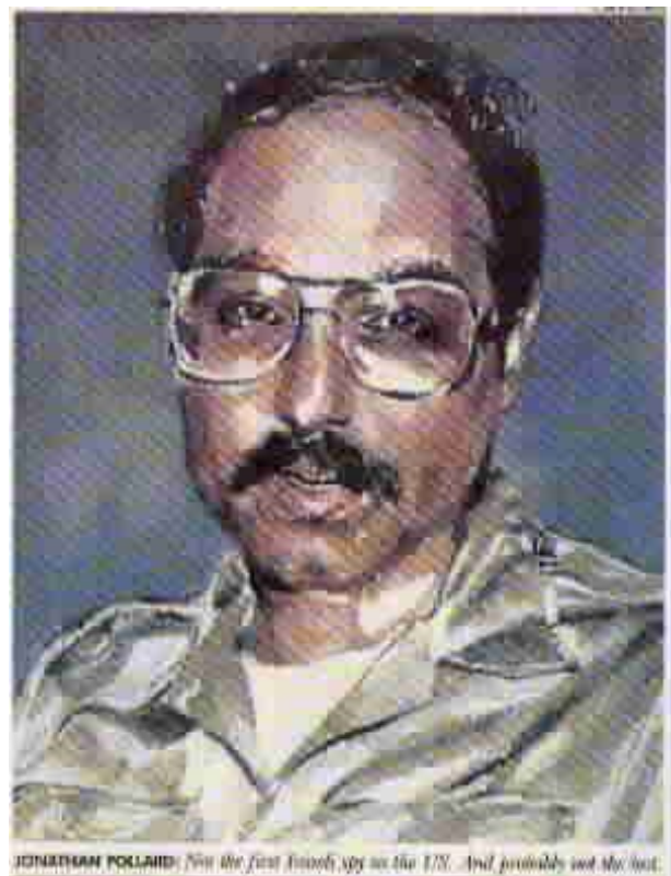
JONATHAN POLLARD: Not the first Israeli spy in the US. And probably not the last.

Einige der ungeheuer sensiblen Informationen, die Pollard gestohlen hat, sind von Israel möglicherweise an die Sowjetunion verkauft oder dieser als Gegenleistung gegen andere Informationen zur Verfügung gestellt worden. Eine ganze Anzahl von CIA-Agenten im Ostblock wurde als Ergebnis von Pollards Spionage dem Vernehmen nach hingerichtet. Wahrscheinlich gewann der KGB Zugang zu streng geheimen amerikanischen Codes, die ihm entweder direkt von Israel oder aber durch Spione in der israelischen Regierung geliefert wurden. Kurz und gut: Pollards Verrat hat dem US-Sicherheitsdienst eine der schlimmsten Katastrophen in der jüngeren Geschichte der Vereinigten Staaten beschert... 377