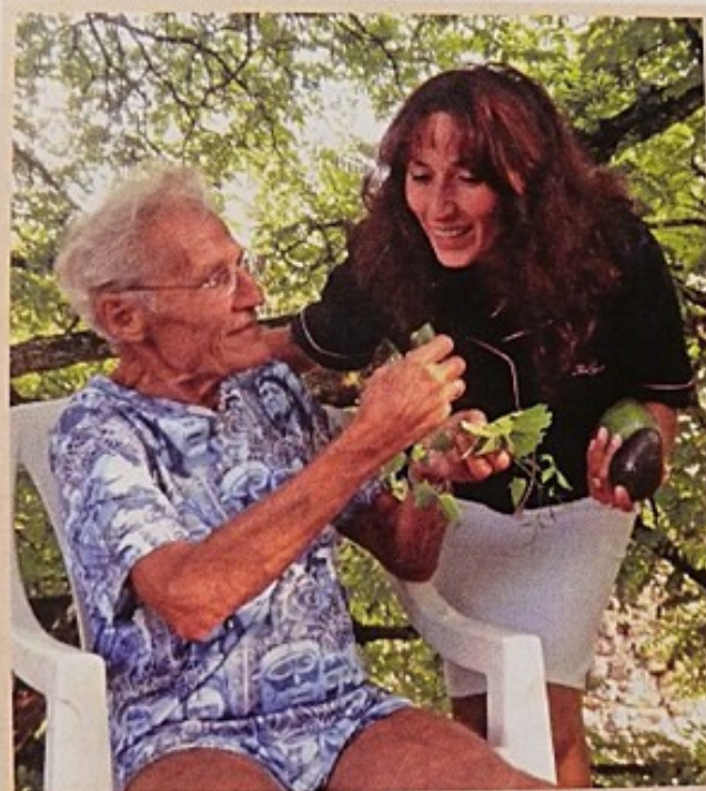
Eine süße Ehefrau, zwei Avokados und Geißbock- kraut - was willst Du mehr?!

e zum Jogging aus sch dem Lauf - der s schon mal abbaut ner so eine gierige enem Maul aus dem hoch, dann iß drei grüne Tonerde und t das nichts, faucht immer, dann hole z oder eine Schote en. Dann zieht sich zurück. Wenn nicht, ll Rosinen. Oder zur 80/2). Oder zu einer st und gut den Hun- nen am Abend nicht, davon ißt.